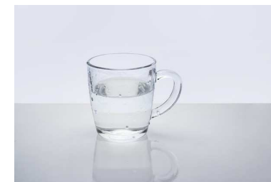
Как донести и ни разу не разлить?