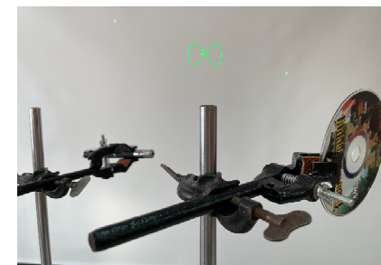
Лазерный зайчик рисует картины.

Из листа бумаги формата А4 сделайте хлопушку (см. видео инструкцию). Если резко махнуть рукой с зажатой хлопушкой, то при ее раскрытии можно услышать громкий хлопок.